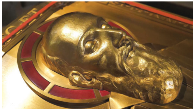
Gisant de la tombe actuelle de saint François de Sales dans la Basilique de la Visitation à Annecy

De son côté, François estime tellement Vincent de Paul qu'il lui demande d'être le Supérieur du monastère de la Visitation qui se fonde à Paris dès l'année