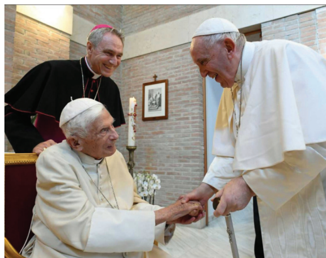
La dernière rencontre du pape François avec Benoît XVI, le 27 août 2022

«Nos pensées vont spontanément à notre très cher Pape émérite Benoît XVI, qui nous a quittés ce