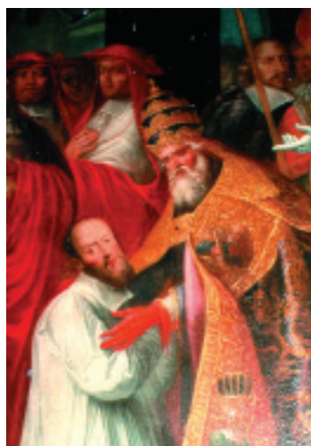
Le Pape reçoit saint François de Sales