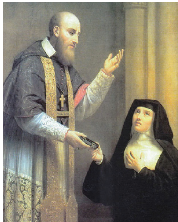
Saint François de Sales et sainte Jeanne de Chantal

En mars 1604, l'évêque de Genève se rend à Dijon pour y prêcher le carême. Un matin, après avoir célébré la Messe, le Seigneur lui révèle qu'il fondera un Ordre de religieuses. Lors d'une prédication, il remarque une jeune femme qui porte le costume des veuves et qui l'écoute avec une attention ardente. Jeanne-Françoise de Chantal, dont le mari est mort tragiquement d'un accident de chasse, avait prié le Seigneur de lui donner un guide spirituel, et Dieu lui avait montré François de Sales, qu'elle reconnaît dès qu'elle l'aperçoit en chaire.