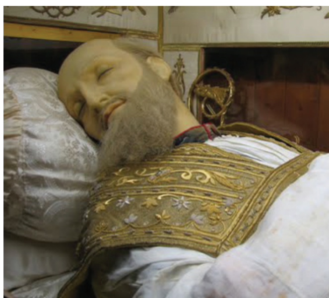
Ancienne statue de cire de saint François de Sales au couvent des Soeurs de la Visitation à Annecy