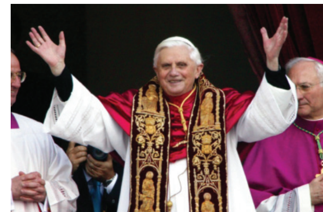
Benoît XVI se présente à la foule pour la première fois

Le conclave pour élire le nouveau pape s'ouvrit le 19 avril 2005 et dura moins de 24 heures, un des plus courts conclaves de l'histoire. À un géant de la foi comme Jean-Paul II, tous les cardinaux ne voyaient comme successeur possible qu'un autre géant de la foi — et collaborateur intime de Jean-Paul II pendant 23 ans — le cardinal Joseph Ratzinger. Et c'est son homélie lors des funérailles, prononcée 11 jours plus tôt, qui a achevé de les convaincre. Ainsi, à 78 ans, il devient le 265e pape, et se présente ainsi à la foule réunie place Saint-Pierre: