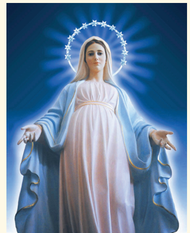
Statue de Notre-Dame de la Paix à Medjugorje

«Chers enfants! Priez avec moi pour la paix car Satan veut la guerre et la haine dans les cœurs et dans les peuples. C'est pourquoi, priez et sacrifiez vos jours par le jeûne et la pénitence afin que Dieu vous donne la paix. L'avenir est à la croisée des chemins, car l'homme moderne ne veut pas de Dieu. C'est pourquoi l'humanité se dirige vers la perdition. Petits enfants, vous êtes mon espérance. Priez avec moi pour que se réalise ce que j'ai commencé à Fatima et ici. Priez et témoignez de la paix autour de vous et soyez des personnes de paix. Merci d'avoir répondu à mon appel.»