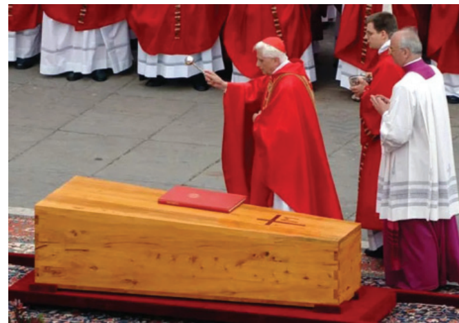
Le cardinal Ratzinger bénissant le cercueil de Jean-Paul II

À la mort de Jean-Paul II, le 2 avril 2005, le cardinal Ratzinger pensait bien qu'il pourrait enfin se retirer et retourner dans sa Bavière natale, mais le bon Dieu avait un autre plan pour lui: succéder à son grand ami comme évêque de Rome et comme pape! En tant que doyen du Collège des cardinaux, c'est lui, Joseph Ratzinger, qui fut appelé à présider la messe de funérailles du pape polonais, et on se souvient tous des paroles touchantes du cardinal Ratzinger lors de son homélie pour l'occasion: