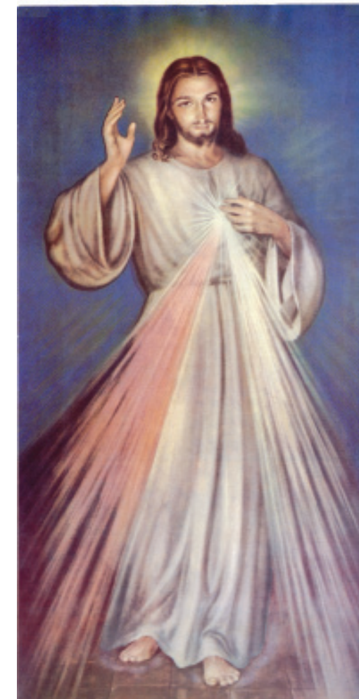
Jésus miséricordieux, j'ai confiance en toi

Pour demeurer en état de grâce, il faut aussi prier. La prière du chapelet est recommandée, ainsi que le port du scapulaire de Notre-Dame du Mont-Carmel.