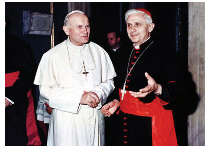
Jean-Paul II et le cardinal Joseph Ratzinger

Ordonné prêtre le 29 juin 1951 en même temps que son frère Georg (âgé de trois ans de plus), Joseph Ratzinger devient un brillant professeur de théologie, spécialiste de saint Augustin et de saint Bonaventure, se distinguant entre autres comme conseiller au concile Vatican II. Le 24 mars 1977, le pape Paul VI le nomme archevêque de Munich et Freising en Allemagne, et le crée cardinal trois mois plus tard. Il prend comme devise d'évêque cette citation de la 3e épître de saint Jean: cooperatores veritatis (coopérateurs de la vérité), qui annonce providentiellement le rôle qu'il aura dans l'Église plus tard.