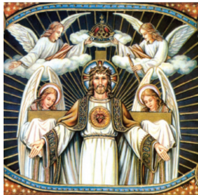
Le trône de Jésus, c'est Sa Croix.

Lui, Il ne se fatigue jamais de pardonner, jamais: Il te remet toujours sur pied, Il te rend toujours ta dignité royale. Oui, le salut d'où vient-il? Du fait de se laisser aimer par Lui, parce que c'est seulement ainsi que nous sommes libérés de l'esclavage de notre moi, de la peur d'être seul, de la pensée de ne pas y arriver.