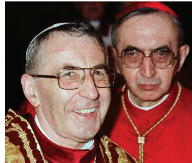
Jean-Paul 1er avec son secrétaire d'État, le cardinal Jean Villot

«C'est une prière très connue, entrelacée de phrases bibliques. C'est ma maman qui me l'a apprise. En-