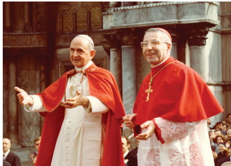
Mgr Luciani avec le pape Paul VI à Venise en 1972

En janvier 1976, Mgr Luciani publie Illustrissimi , (en français, humblement vôtre) un recueil de 40 lettres imaginaires (écrites entre 1971 et 1975 et publiées mensuellement dans la revue «Il Messaggero di S. Antonio») adressées à des saints, des personnages histo-