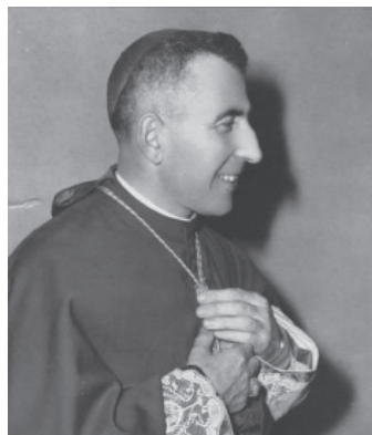
Évêque de Vittorio Veneto en 1959