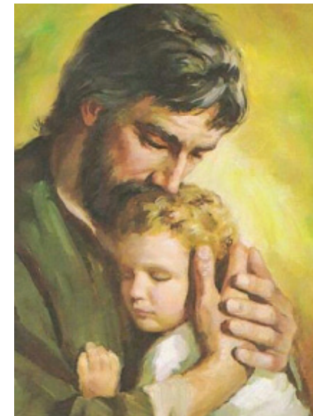
L'image de saint Joseph remise au Saint-Père

Alors que je m'avançais pour saluer le Saint-Père, je lui tendis l'image de saint Joseph et lui dis simplement: «Saint-Père, je suis un ami de saint Joseph». Il m'a regardé, puis a regardé attentivement l'image de saint Joseph, a souri et a dit: «S'il vous plaît, priez saint Joseph pour moi.»