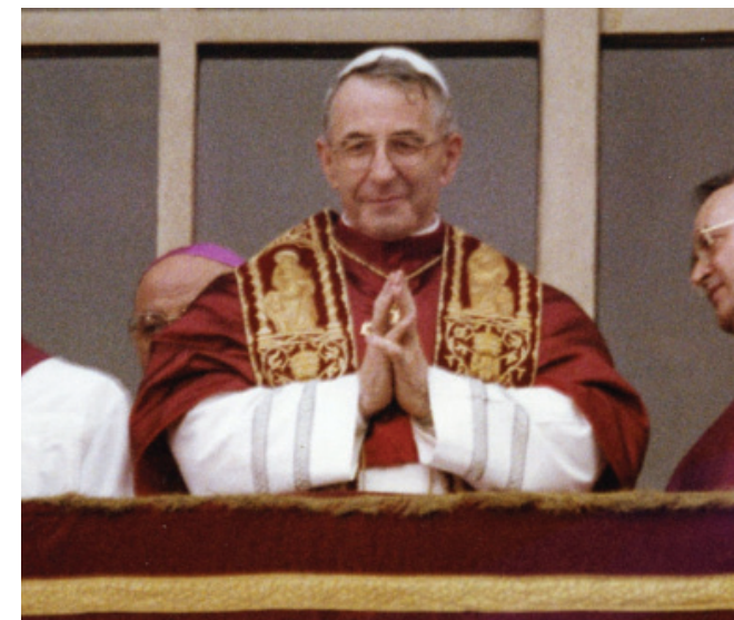
Jean-Paul 1er apparaît pour la première fois au balcon de la Basilique Saint-Pierre après son élection.

«D'autre part, en 15 ans de pontificat, ce Pape a montré non seulement à moi, mais au monde entier, comment on aime, comment on sert, comment on travaille et on souffre pour l'Eglise du Christ. Pour cela j'ai dit: «Je m'appellerai Jean-Paul». Je n'ai ni la «sagesse du cœur» du Pape Jean, ni la préparation et la culture ►