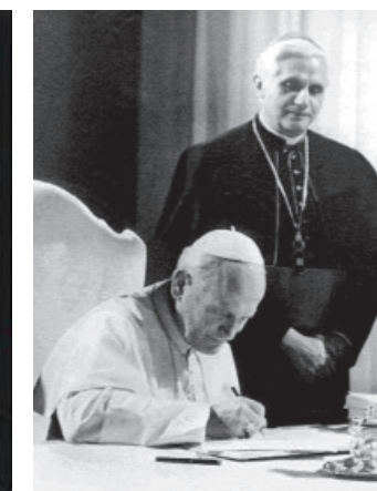
À droite, Jean-Paul II apposant sa signature au nouveau catéchisme, en présence du cardinal Ratzinger.

sa vie divine — avec nous. C'est parce que Dieu est amour qu'il est un seul Dieu en trois personnes: il ne peut être solitaire. La connaissance que Dieu a de Lui-même est le Verbe — le Fils, et cet amour du Père pour le Fils est le Saint-Esprit. Jésus dit: «Moi et le Père nous sommes un» (Jean 10, 30).