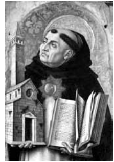
Saint Thomas d'Aquin

«Il est écrit dans le livre de l'Exode (22, 24): "Si tu prêtes de l'argent à quelqu'un de mon peuple, au pauvre qui est avec toi, tu ne seras point à son égard comme un créancier, tu ne l'accableras pas d'intérêts." Recevoir un intérêt pour l'usage de l'argent prêté est de soi injuste, car c'est faire payer ce qui n'existe pas; ce qui constitue évidemment une inégalité contraire à la justice... c'est en quoi consiste l'usure. Et comme l'on est tenu de restituer les biens acquis injustement, de même l'on est tenu de restituer l'argent reçu à titre d'intérêt.»