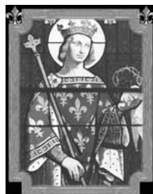
Saint Louis IX

Il n'est pas du tout nécessaire ni recommandable de supprimer les banques, ni de les nationaliser. Le banquier est un expert en comptabilité et en placements: qu'il continue à recevoir et faire fructifier les épargnes, prenant sa part de profit. Mais manufacturer l'argent est un acte de souveraineté qui ne doit pas être lié à la banque. Il faut sortir la souveraineté de la banque et la replacer entre les mains de la nation.